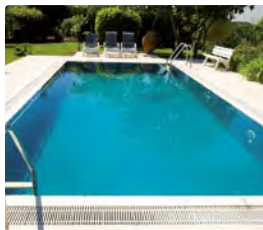
Schwimmbecken und Spa