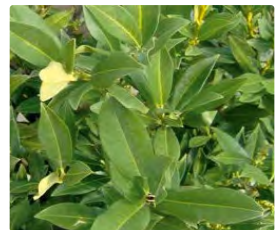
Pflanzen und Rasen