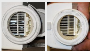
Filtro para piscina