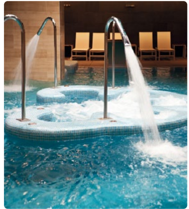
Piscina de agua salada termal

Las piscinas son sistemas con circuito medio abierto que pierden agua constantemente a medida que el agua se evapora. Incluso unos índices bajos de dureza de agua ocasionan depósitos calcáreos dañinos que exigen una limpieza constante. Vulcan disminuye los trabajos de limpieza en la piscina, como en las tuberías, baldosas, rejillas, pisos y paredes. La manutención de duchas, cabezales, grifos e inodoros se facilita sustancialmente.