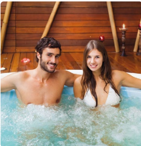
Piscina de hidromasaje en el área de spa de un hotel