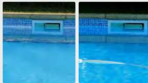
Wasserlinie am Beckenrand