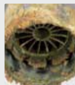
Perlatorsieb eines Wasserhahns