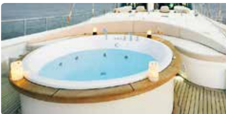
Jacuzzi auf dem Deck einer Luxusyacht.