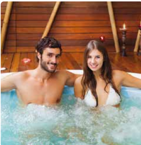
Whirlpool in einem Hotel Wellnessbereich