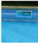
Wasserlinie am Beckenrand