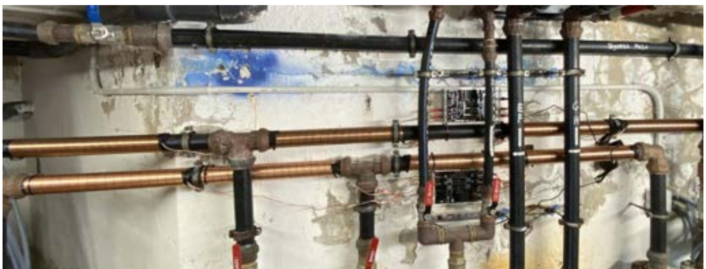
Vulcan S25 Kaltwasser Hauptleitung mit Ø 50 mm für 48 Wohnungen