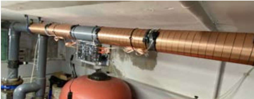
Vulcan S50 im Wasserkreislauf von Pool N°1 mit Ø 90 mm