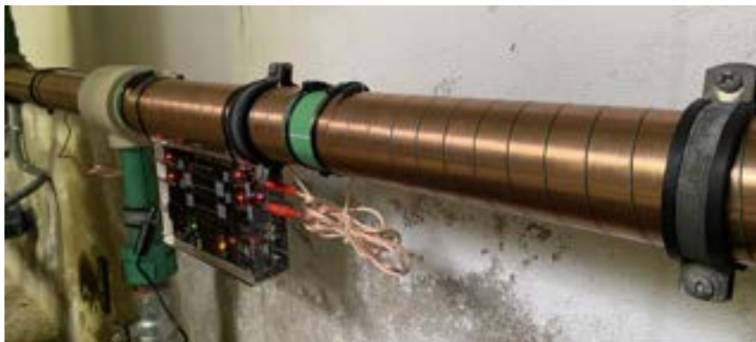
Vulcan S25 Kaltwasser Hauptleitung mit Ø 63 mm für 30 Wohnungen